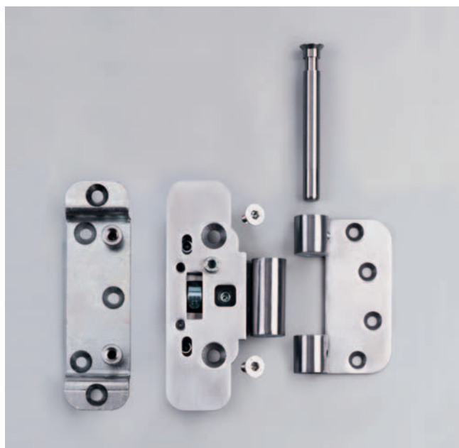
■ Fogadóelem utólag szerelhető tokhoz