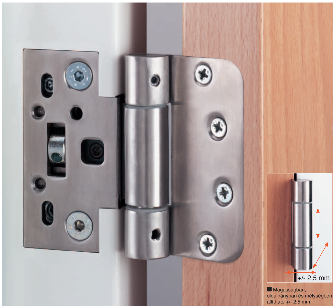
■ Magasságban, oldalirányban és mélységben állítható +/- 2,5 mm